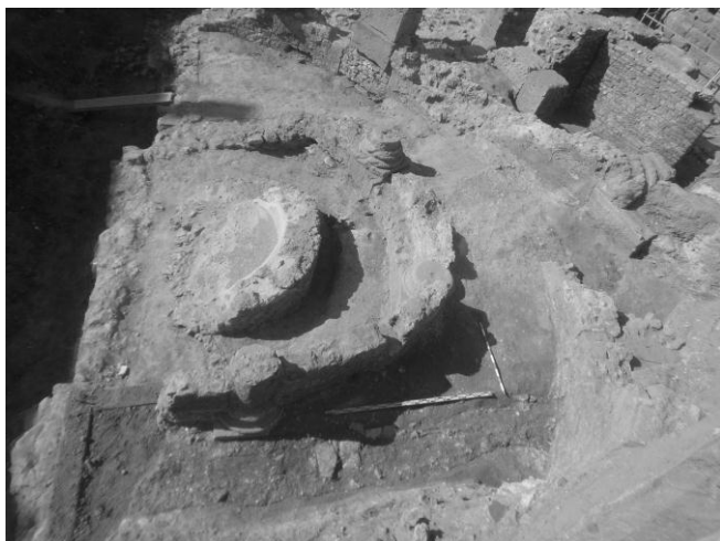
Fig. 1. Exedra del c) Vapor.