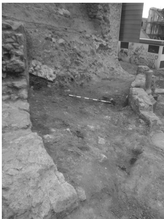
Fig. 2: Nivell de destrucció de l'exedra (Foto J. Morera).